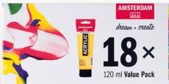
Sada akrylových barev Amsterdam Standard - 18 x 120 ml