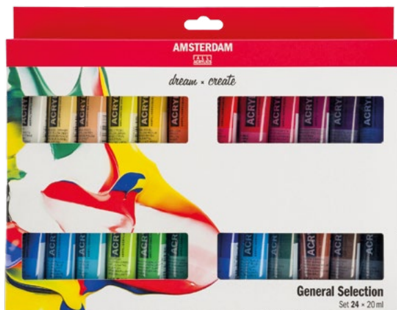
Sada akrylových barev Amsterdam Standard - 24 x 20 ml

Barvy Amsterdam Standard jsou vyrobeny na bázi 100% akrylové emulze a vysoce kvalitních pigmentů. Užijte si vynikající světlost a rozmanité krycí schopnosti. Tyto barvy střední viskozity se snadno nanášejí a vytvářejí hladký barevný povrch. Jsou vhodné pro různé techniky i podklady.