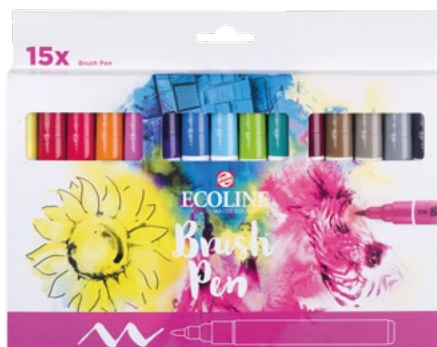
Sada 15ks Ecoline Brush Pen

Ecoline Brush Pen jsou akvarelové fixy s flexibilním nylonovým hrotem, které umožňují jemné tahy, plynulé přechody i široké využití v akvarelových technikách. Jsou vhodné na skicování ale i kaligrafii.