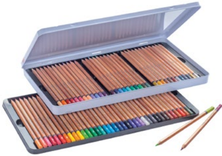
Sada barevných pastelek Bruynzeel 72 ks

Kvalitní, měkké a skvěle pigmentované pastelky, které překvapí famózním poměrem cena/výkon. Ideální pro každodenní kresbu, skicování i barevné ilustrace.