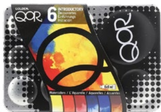
Golden QoR Introductory Set - základní sada akvarelových barev QoR, 6 x 5 ml

Golden QoR přináší revoluci ve světě akvarelu díky exkluzivnímu pojivu Aquazol®, které zajišťuje mimořádnou koncentraci pigmentu v každém tahu štětce. Výsledkem je intenzita, barevný rozsah a všestrannost, jaké nemají v historii akvarelových barev obdoby.